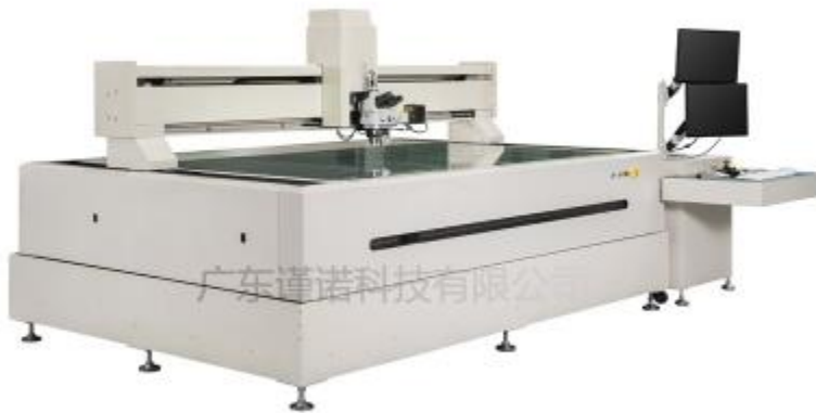
Automatic tool metallographic measuring instrument V800