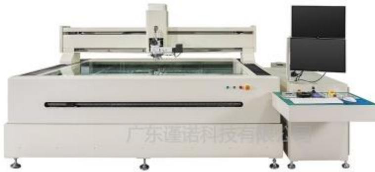
Automatic tool metallographic measuring instrument V2000