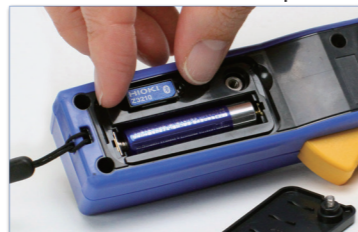
Step 1 : Install Z3210 to the instrument. (Location varies according to the model.)